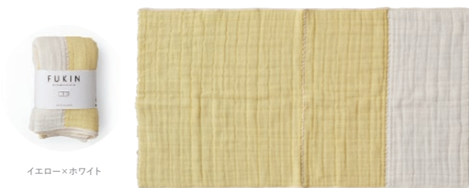
イエロー×ホワイト