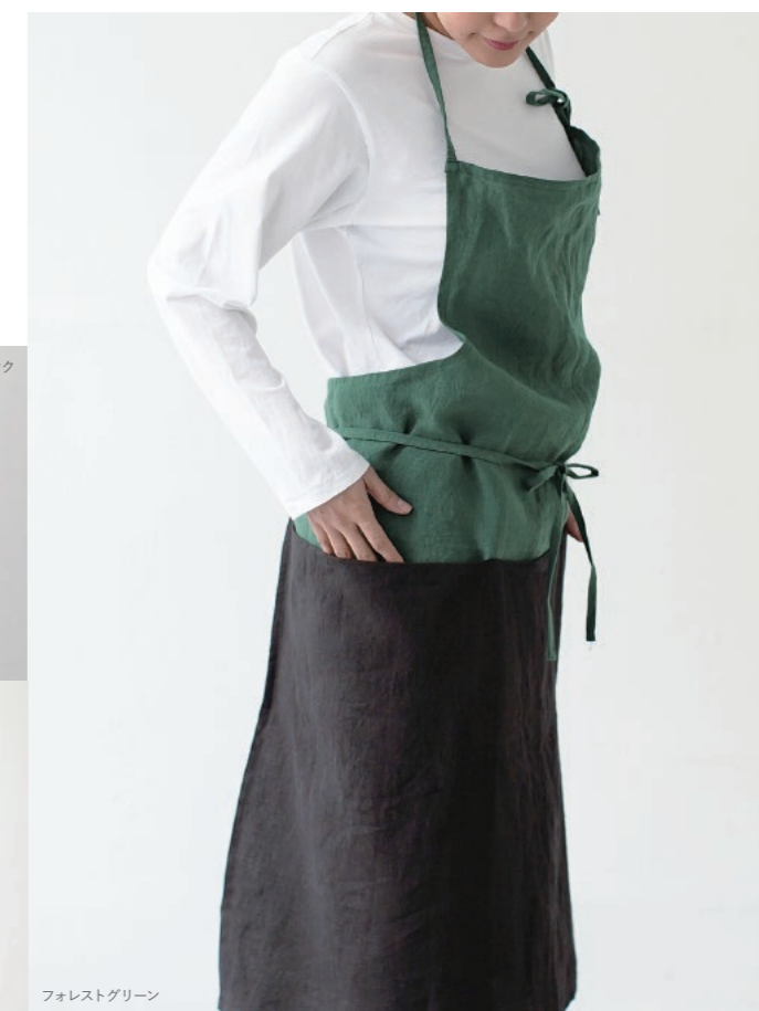
フォレストグリーン