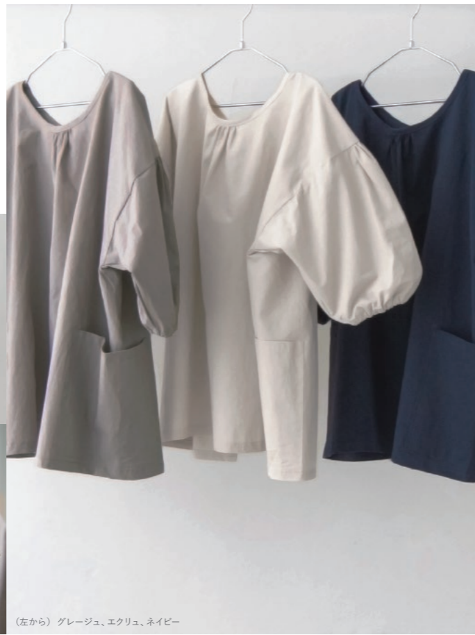
(左から) グレージュ、エクリュ、ネイビー