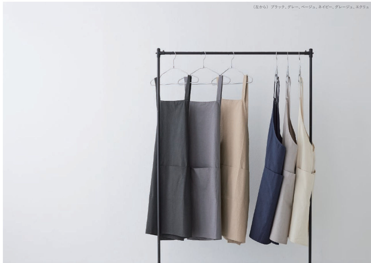
(左から) ブラック、グレー、ベージュ、ネイビー、グレージュ、エクリュ