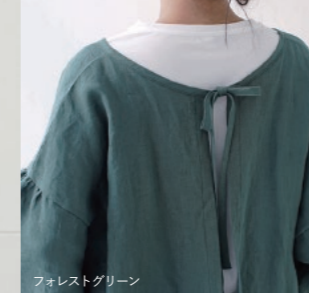
フォレストグリーン