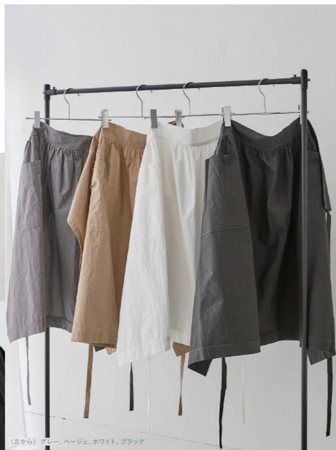
(左から) グレー、ベージュ、ホワイト、ブラック